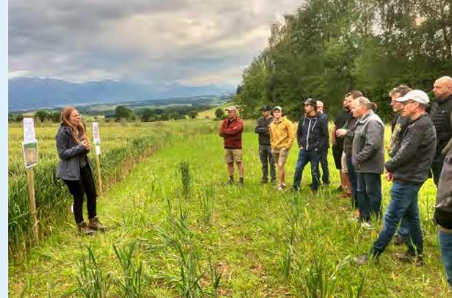
An regionalen Flurbegehungen informieren die Berufsbildungszentren Natur und Ernährung in Hohenrain und Schüpfheim regelmässig praxisnah über die neuesten Erkenntnisse und Erfahrungen im Ackerbau, im Futterbau, in der Tierhaltung und im Biolandbau.