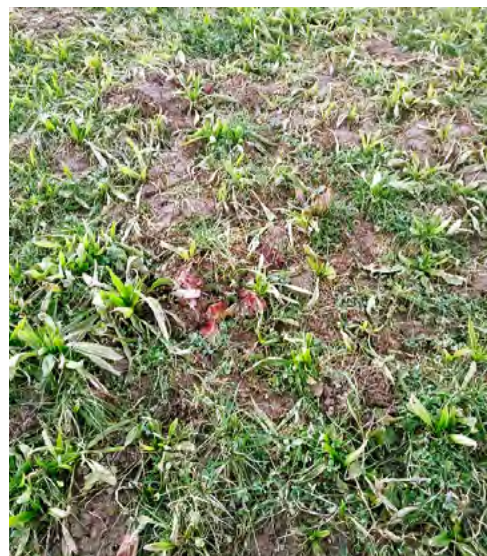
Weidemischung mit Spitzwegerich, welche stellenweise unter starken Mäuseschäden leidet.

Kurze Bestände sollten jetzt mit 20 m 3 /ha Rindergülle angedüngt werden. Somit wird die Be-