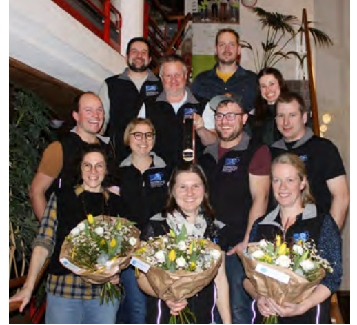
Ein herzliches Dankeschön an alle, die sich die Zeit genommen haben, um an die GV 2025 zu kommen. Das hat uns sehr gefreut.