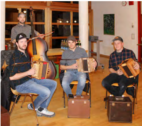
Die Chlaus-Musig-Ebnet bot beste Unterhaltung.

Demnächst wird man sich gemeinsam mit dem BBZN mit der Frage auseinandersetzen, wo der EV in Zukunft seine Schwerpunkte setzen soll.