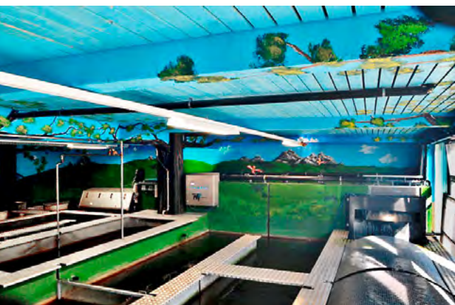
Die Indooranlage der Fricon, einem Entlebucher Familienbetrieb, der seit 2012 besteht, ist auf eine Fischproduktion von 12 Tonnen ausgelegt.

In der Schweiz wurden im Jahr 2023 pro Kopf rund acht Kilogramm Fisch und Schalentiere verzehrt. Im Vergleich zum Fleischkonsum – da waren es 46 Kilo Geflügel-, Rind- und Schweinefleisch – ist dies ein eher kleiner, dafür aber konstanter Anteil. Nur gerade 3–5 Prozent der konsumierten Fischprodukte stammen aus dem Inland.